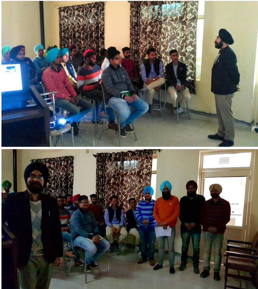
Students attending lecture on “Industrial Engineering”