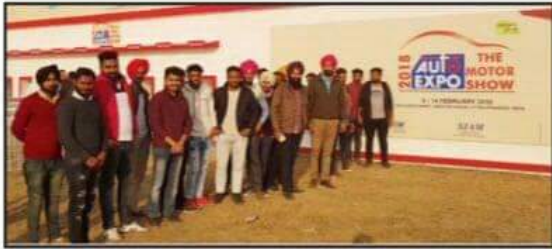
ਪਟਿਆਲਾ, 12 ਫਰਵਰੀ ਖਾਲਸਾ ਕਾਲਜ ਪਟਿਆਲਾ ਦੇ ਚੀਨ ਦਿਆਲ ਉਪਾਧਿਆਏ ਕੌਸ਼ਲ ਕੇਂਦਰ (ਯੂ.ਜੀ.ਸੀ. ਸਪਾਸਰਡ) ਅਧੀਨ ਚੱਲ ਰਹੇ ਆਟੋ ਮੋਬਾਈਲ ਵਿਭਾਗ ਦੇ ਵਿਦਿਆਰਥੀਆਂ ਨੇ ਆਟੋ ਮੋਬਾਈਲ ਸਕਿੱਲ ਡਿਵੈਲਪਮੈਂਟ ਕਾਊਂਸਿਲ ਵੱਲੋਂ ਲਗਾਏ ਗਏ ਗਲੋਬਲ ਇੰਟੀਚਿਊਟ ਆਡ ਇਨਫਾਰਮੇਸ਼ਨ ਐਂਡ ਟੈਕਨਾਲੋਜੀ ਗਰੇਟਰ ਨੇਇਡ ਵਿਖੇ ਹੁਨਰ-ਜੇ-ਰੋਜ਼ਗਾਰ ਮੈਲੇ ਅਤੇ ਆਟੋ ਐਕਸਪੋ-2018 ਦਾ ਇਕ ਰੋਜ਼ਾ ਵਿਦਿਅਕ ਦੌਰਾ ਕੀਤਾ। ਹੁਨਰ-ਜੇ-ਰੋਜ਼ਗਾਰ

ਵਿੱਚ ਮੋਡਮ ਪੂਜਾ ਅਤੇ ਸੂੀ ਗੇਰਵ ਨੇ ਵਿਦਿਆਰਥੀਆਂ ਨੂੰ ਆਟੋ ਮਿਟਿੰਗ ਸਕਿੱਲ ਡਿਵੈਲਪਮੈਂਟ ਕਾਊਂਸਿਲ ਅਧੀਨ ਚੱਲ ਰਹੇ ਵੱਖ-ਵੱਖ ਸਕਿੱਲ ਡਿਵੈਲਪਮੈਂਟ ਪ੍ਰੋਗਰਾਮ ਬਾਰੇ ਜਾਣੂ ਕਰਵਾਇਆ ਅਤੇ ਕਿਹਾ ਕਿ ਇਹ ਸੰਸਥਾ ਦੇਸ਼ ਦੀ ਤਰੱਕੀ ਵਿੱਚ ਅਹਿਮ ਯੋਗਦਾਨ ਪਾ ਰਹੀ ਹੈ। ਇਸ ਮੌਕੇ ਵਿੱਚ ਮਾਤੂਗੋ, ਟਾਟਾ, ਹਾਂਡਾ ਆਦਿ ਵਰਗੀਆਂ ਕੰਪਨੀਆਂ ਦੇ ਨੁਮਾਇੰਦਿਆਂ ਨੇ ਵੀ ਸ਼ਿਰਕਤ ਕੀਤੀ। ਆਟੋ ਐਕਸਪੋ-2018 ਵਿਚ ਵਿਦਿਆਰਥੀਆਂ ਨੇ ਇਕੋ-ਫਰੰਡਲੀ ਇਲੈਕਟ੍ਰਿਕ ਕਾਰਾਂ ਬਾਰੇ ਪ੍ਰਦਰਸ਼ਨੀ ਵੇਖੀ ਜੋ ਅਜੋਕੇ ਸਮੇਂ ਵਿਚ ਵਾਰਾਵਰਣ ਦੀ ਲੋੜ ਨੂੰ ਮੁੱਖ ਰੱਖ ਕੇ ਬਣਾਈਆਂ ਗਈਆਂ ਹਨ। ਇਸ ਪ੍ਰਦਰਸ਼ਨੀ ਵਿਚ ਵਿਦਿਆਰਥੀਆਂ ਨੂੰ ਅਨੇਕਾਂ ਦੋਸ਼ਾਂ ਦੀਆਂ ਯੂਨੀਵਰਸਿਟੀ ਦੇ ਵਿਦਿਆਰਥੀਆਂ ਦੁਆਰਾ ਬਣਾਏ ਗਏ