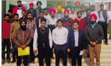
ਖਾਲਸਾ ਕਾਲਜ ਪਟਿਆਲਾ ਦੇ ਵਿਦਿਆਰਥੀ ਹੁਨਰ-ਜੇ-ਰੋਜ਼ਗਾਰ ਮੈਲੇ ਦੌਰਾਨ ਆਪਣੇ ਅਧਿਆਪਕ ਅਤੇ ਡੇ.ਐਸ. ਡੀ.ਸੀ. ਦੇ ਅਧਿਆਪਕਾਂ ਨਾਲ

ਪਟਿਆਲਾ, 12 ਫਰਵਰੀ ਖਾਲਸਾ ਕਾਲਜ ਪਟਿਆਲਾ ਦੇ ਚੀਨ ਦਿਆਲ ਉਪਾਧਿਆਏ ਕੌਸ਼ਲ ਕੇਂਦਰ (ਯੂ.ਜੀ.ਸੀ. ਸਪਾਸਰਡ) ਅਧੀਨ ਚੱਲ ਰਹੇ ਆਟੋ ਮੋਬਾਈਲ ਵਿਭਾਗ ਦੇ ਵਿਦਿਆਰਥੀਆਂ ਨੇ ਆਟੋ ਮੋਬਾਈਲ ਸਕਿੱਲ ਡਿਵੈਲਪਮੈਂਟ ਕਾਊਂਸਿਲ ਵੱਲੋਂ ਲਗਾਏ ਗਏ ਗਲੋਬਲ ਇੰਟੀਚਿਊਟ ਆਡ ਇਨਫਾਰਮੇਸ਼ਨ ਐਂਡ ਟੈਕਨਾਲੋਜੀ ਗਰੇਟਰ ਨੇਇਡ ਵਿਖੇ ਹੁਨਰ-ਜੇ-ਰੋਜ਼ਗਾਰ ਮੈਲੇ ਅਤੇ ਆਟੋ ਐਕਸਪੋ-2018 ਦਾ ਇਕ ਰੋਜ਼ਾ ਵਿਦਿਅਕ ਦੌਰਾ ਕੀਤਾ। ਹੁਨਰ